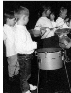
... mit Feuereifer dabei!

MF 1/03: mittwochs 15.15 bis 16.15 Uhr, ab 1.9.04; Leitung: Marita Ermert