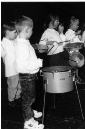
Mit Feuereifer dabei

Vor der Aufnahme des Unterrichts ist ein Gespräch mit der Musikschulleitung über die pädagogische Zielsetzung sowie den Organisationsablauf zu empfehlen.