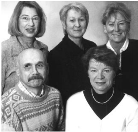
Die MitarbeiterInnen der vhs Dietzenbach. V. von links: (stehend):

a.) Bei Kursen mit weniger als 3 Unterrichtseinheiten/Kurstag und mindestens 8 Veranstaltungsterminen besteht Gebührenpflicht , wenn keine schriftliche Abmeldung bis spä-