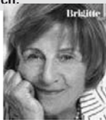
Eine unbeugsame Frau Margarete Mitscherlich