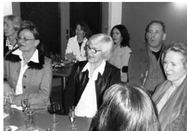
Kursleiter/innen beim Jahrestreffen 2008