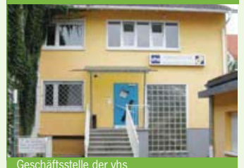
Geschäftsstelle der vhs

vhs im Vorderhaus, im Hinterhaus und in der Bewegungshalle in der Wilhelm-Leuschner-Straße 33 Ernst-Reuter-Schule: Dr. Heumann Weg 1 Weitere Kursorte mit Anschriften sind im Kursangebot genannt.