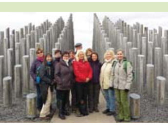
Impression einer Wanderung