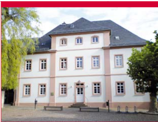
Haus der Musik