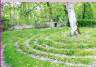
Labyrinth auf dem Disibodenberg