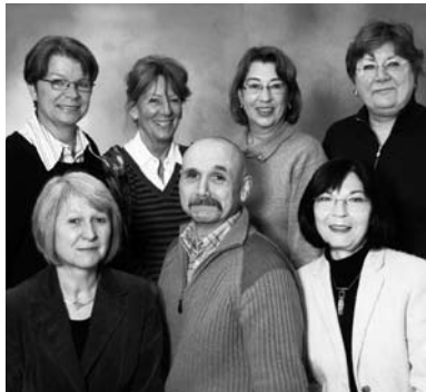
Die Mitarbeiter/innen der vhs Dietzenbach e.V. von links stehend:

b.) Bei Kursen mit 8 oder weniger Veranstaltungsterminen entfällt die Gebührenpflicht, wenn bis drei Wochen vor dem Veranstaltungstermin eine schriftliche Abmeldung vorliegt. Erfolgt eine Abmeldung später, so werden