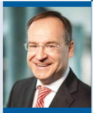
Oliver Quilling, Landrat