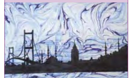
Ebru-Kunst von Nesrin Cosgun

Rödermark (Waldacker), Bürgertreff, Goethestr. 39, Veranstaltungsraum Mo, ab 06.10.2014 , 18.00-21.00 Uhr € 100,-, 10 Termine, 40 UE