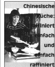
Renate Büttners Menü-Kochbuch (Band 1)